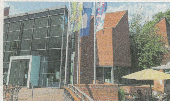
Vor der Kunsthalle Emden ist Montag viel los.