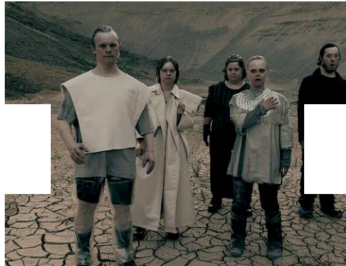
Planet HORA: Ein Film von Theater Hora (November)