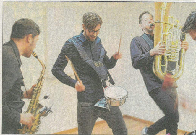
Die Hamburger Marching-Band „Billy Burrito“ ist am 3. Oktober rund um die Kunsthalle unterwegs.

Viele Mitmach-Aktionen knüpfen an das Ausstel-