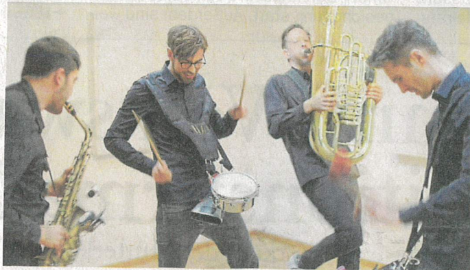
Die Band „Billy Burrito“ mischt den Henri-Nannen-Platz am Tag der offenen Tür auf

Viele Mitmachaktionen knüpfen an das Ausstellungsthema „Wald“ an. Nicht fehlen dürfen stündliche Führungen durch die Kunsthalle. Details zum Gesamtprogramm inklusive Zeitplan und Anmelde-möglichkeiten sind unter www.kunsthalle-emden.de zu finden.