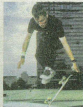
Nicht nur BMX-Köner kommen: Auch Freestyle-Skateboard-Weltmeister Günter Mokulyus zeigt, was er kann.

Für ein anderes interaktives Hörerlebnis zur Wald-Ausstellung sorgt dank Förderung von der Stiftung Pro Helvetia und der Stadt Zürich das Schweizer Ensemble Mandarina & Co. (15 und 18 Uhr). „Geboten wird ein Mix aus Theater, Soundcollage und Performance“, erläutert